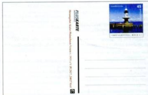
Der Leuchtturm Brunsbüttel, Mole 1, ist im Wertstempel