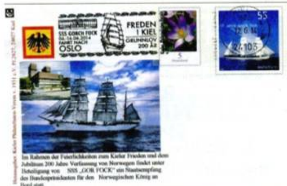
Diese Ganzsache erinnert an den Staatsempfang, den Bundespräsident