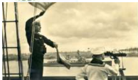
Oben auf dem Signalturm