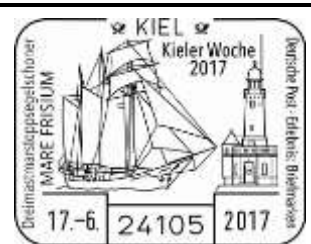
SST 5) Mare Frisium

Liebe Sammlerfreunde, Kiel rüstet sich wieder für das größte Sommerfest Nordeuropas. Die Kieler Woche wird 135 Jahre alt und wird ca. 3 Millionen Besucher und mehr als 5000 Segler aus aller Welt zwischen dem 17. und 25. Juni erwarten. Es sind weitere schöne Belege aus unserem Raum mit aufgeführt. Beachten Sie auch wieder unsere Sonderlisten mit vielen Schiffs-Stempeln.. 5 Sonderstempel und 1 Feldpoststempel sowie (2 ehemals,,Infopost)-Cachet-Stempel !