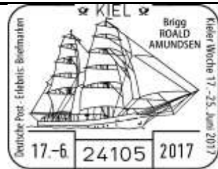
SST 4) Roald Amundsen