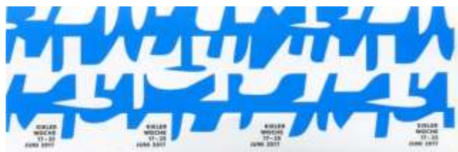
Vignettenstreifen Kieler Woche