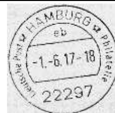
Taufe Hamburg und Jungfernfahrt ab Kiel