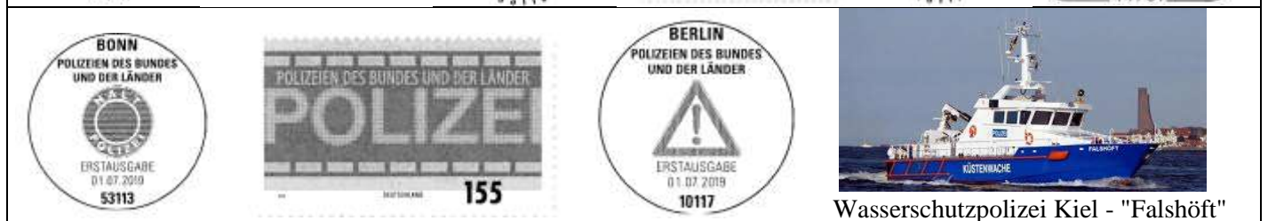
Wasserschutzpolizei Kiel - "Falshöft"