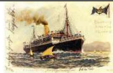
Dampfer „Kronprinzessin Cecilie“